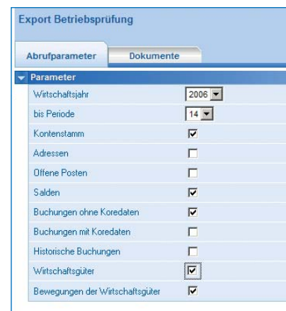
Ausgabe der Datenträgerüberlassung im IDEA-Format.