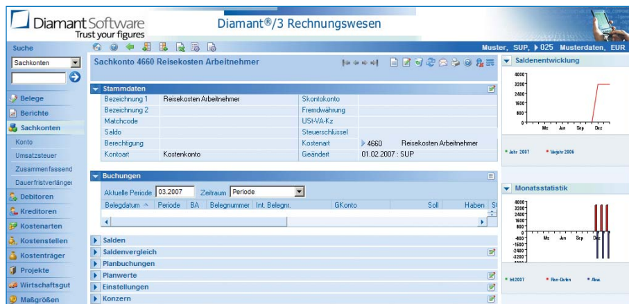
Spezielle, dezimierte Menü-Auswahl für den Betriebsprüfer.

Das Modul bietet die Datenträgerüberlassung im IDEA-Format. IDEA ist die von deutschen Finanzbeamten zur Analyse der Datenträger genutzte Prüfsoftware. Für die Datenträgerüberlassung stellt die Diamant®/3 Finanzbuchhaltung die steuerlich relevanten Daten so zur Verfügung, dass sie von der Prüfsoftware IDEA eingelesen und analysiert werden können. Per Knopfdruck werden die Daten automatisch im IDEA-Format erzeugt und zum Beispiel auf einer CD gespeichert.